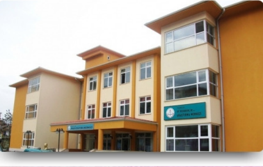
OF REHBERLİK VE ARAŞTIRMA MERKEZİ